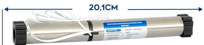
MOTOR 0.8NM BIVOLT