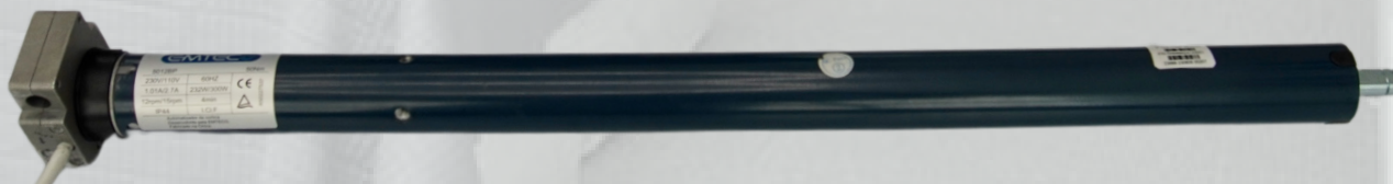
Motor 50 NM com Comando Socorro* [65cm]